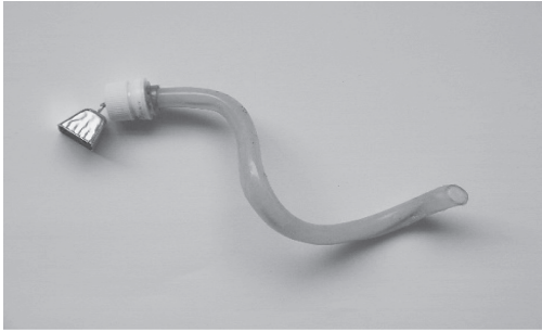
写真1 フリーハンドベル

出来上がったハンドベルは、児童生徒の手の状態に応じて曲げることができる。また音源も目的に応じて取り換えることができる（写真1）。