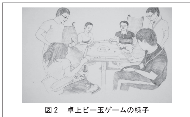
図2 卓上ビー玉ゲームの様子