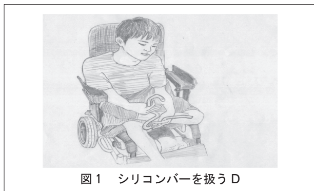
図1 シリコンバーを扱うD

課題遂行後の疲れも目立つようになってきた。そこでシリコンバーを用いることを止めた。